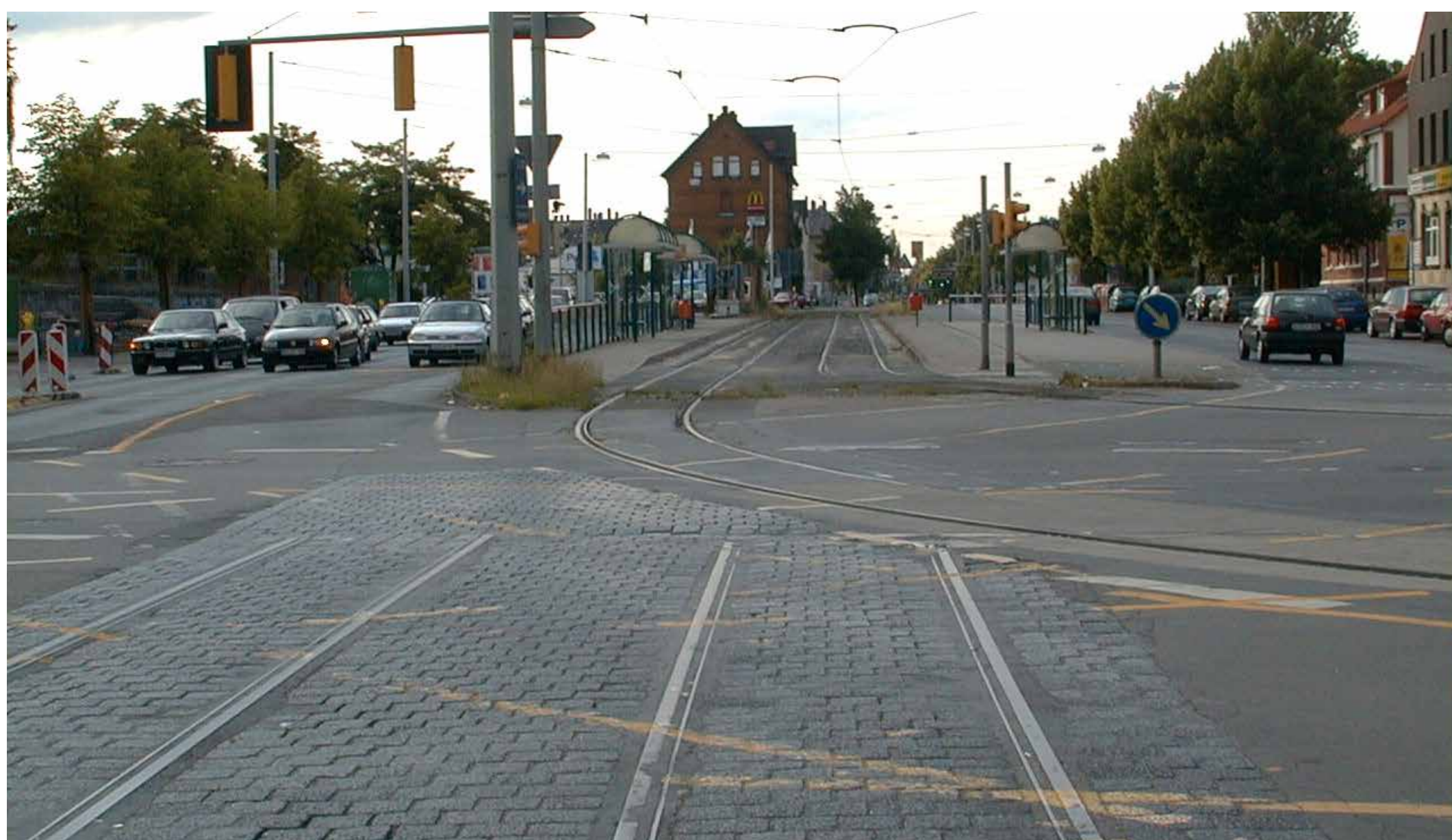
Hamburger Straße 1998