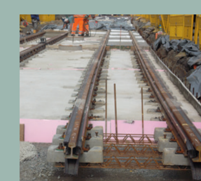
Hochelastische Schienenlagerung auf der Leonhardstraße

Elastische Schienenlagerung Mit speziellen Gummiprofilen oder Unterlagen im Bereich des Schienenfußes wird das Gleis elastisch gelagert. Durch Einfederungen von ca. 1,5 mm werden Schwingungen aus dem Gleis wirksam gemindert.