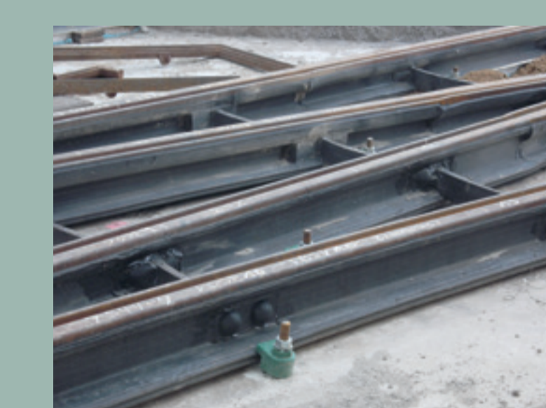
Elastische Schienenlagerung auf dem Hagenmarkt

Elastische Schienenlagerung Mit speziellen Gummiprofilen oder Unterlagen im Bereich des Schienenfußes wird das Gleis elastisch gelagert. Durch Einfederungen von ca. 1,5 mm werden Schwingungen aus dem Gleis wirksam gemindert.