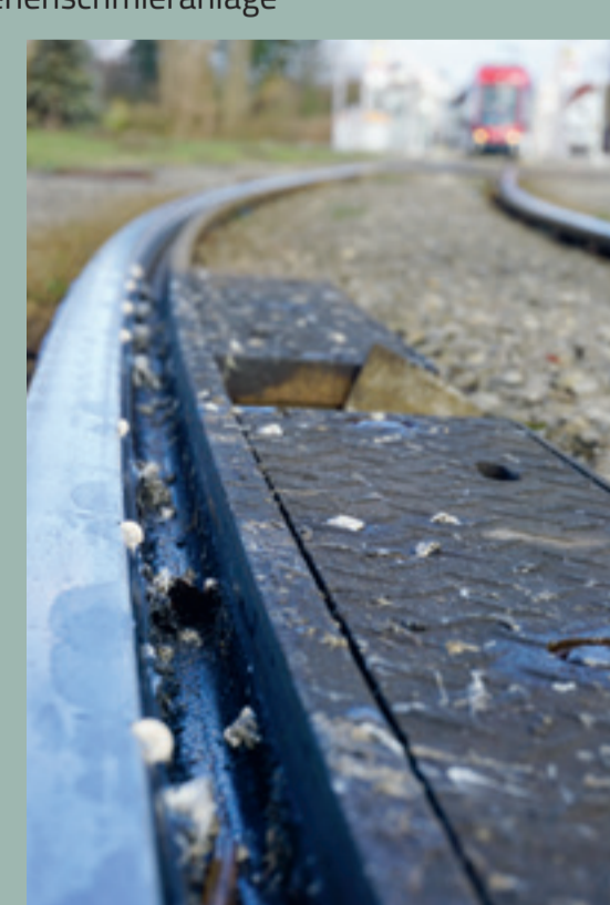
Beispiel: Schienenschmieranlage mit Schmiermittel

Das speziell entwickelte Schmiermittel ist biologisch abbaubar. Es wird exakt und sparsam dosiert, ohne die Umwelt zu verschmutzen.