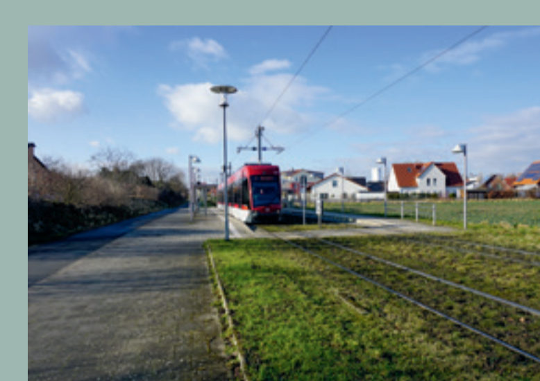
Beispiel: Rasengleis in Stockheim

Rasengleis mit hoher Eindeckung mindert Luftschall Die Schienen sind bis unterhalb des Kopfes mit Rasen eingedeckt. Die offene Struktur der Rasenoberfläche schluckt Schallwellen am Ort der Entstehung.