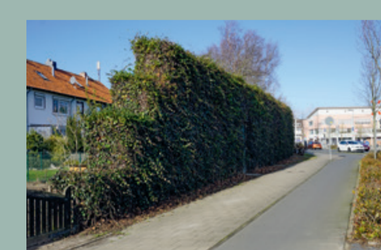
Beispiel: Leipziger Straße/Brauereiskamp in Stockheim

Schutzwall Minderung der Luftschallausbreitung durch begrünten Wall