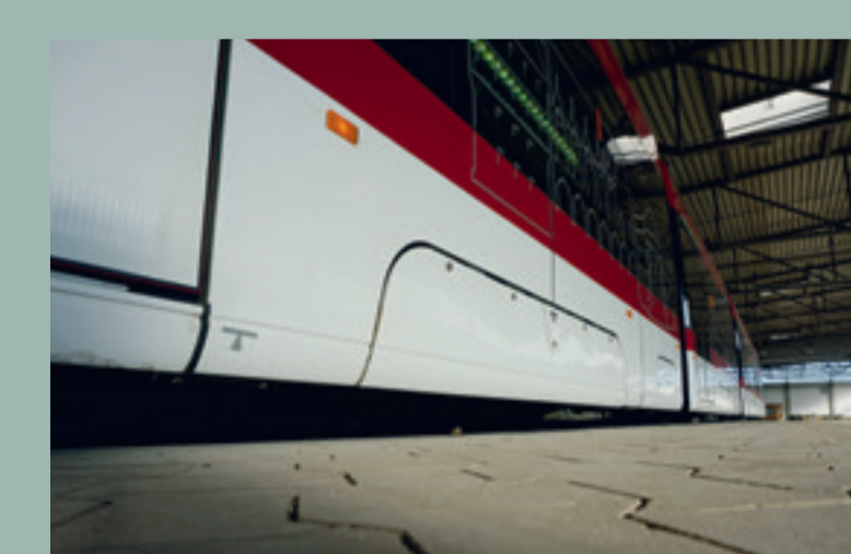
Radabdeckung beim Tramno

Lösung: Durch regelmäßige Bearbeitung der Radreifen auf der Radsatzdrehmaschine werden Störstellen auf der Radlauffläche beseitigt, die Laufruhe wird erhöht.