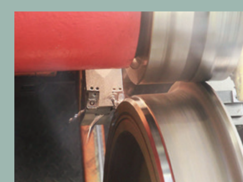
Beispiel für eine Radsatzdrehmaschine

Radsatzbearbeitung mindert Luftschall und Erschütterungen Problem: Durch starke Bremsvorgänge können am Radreifen Unrundungen (Flachstellen) entstehen, die Poltergeräusche beim Fahren verursachen.