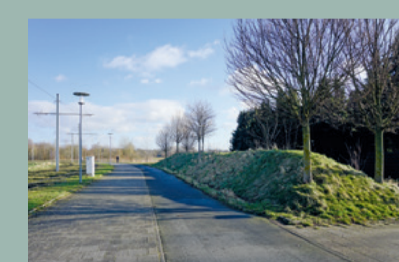
Beispiel: Ostpreussendamm/Waldenweg in Stockheim

Schutzwall Minderung der Luftschallausbreitung durch begrünten Wall