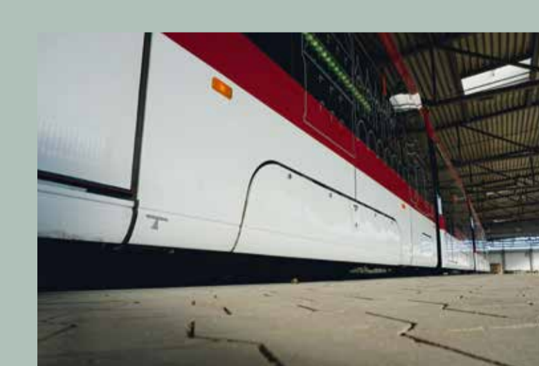
Radabdeckung beim Tramino

Lösung: Durch regelmäßige Bearbeitung der Radreifen auf der Radsatzdrehmaschine werden Störstellen auf der Radlauffläche beseitigt, die Laufruhe wird erhöht.