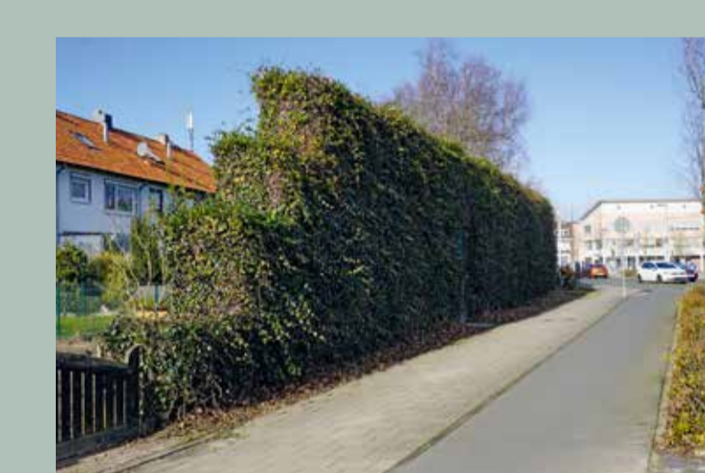
Beispiel: Leipziger Straße/Brauereikamp in Stockheim

Schutzwall Minderung der Luftschallausbreitung durch begrünten Wall