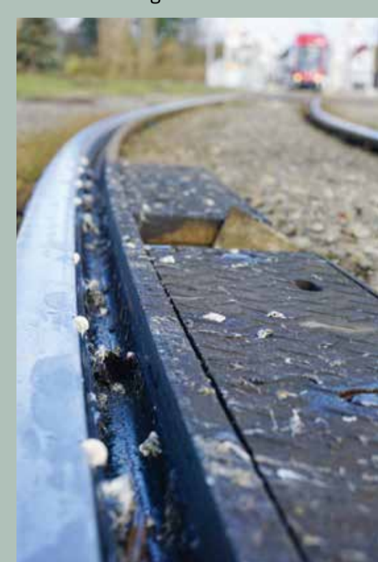
Beispiel: Schienenschmieranlage mit Schmiermittel

Das speziell entwickelte Schmiermittel ist biologisch abbaubar. Es wird exakt und sparsam dosiert, ohne die Umwelt zu verschmutzen.