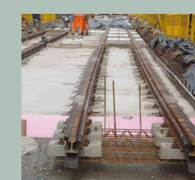
Hochelastische Schienenlagerung auf der Leonhardstraße

Elastische Schienenlagerung Mit speziellen Gummiprofilen oder Unterlagen im Bereich des Schienenfußes wird das Gleis elastisch gelagert. Durch Einfederungen von ca. 1,5 mm werden Schwingungen aus dem Gleis wirksam gemindert.