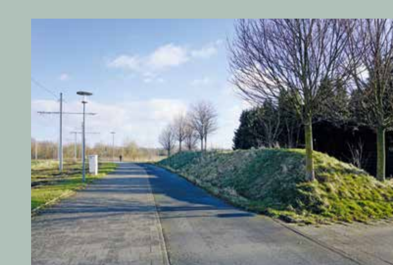
Beispiel: Ostpreussendamm/Waldenweg in Stockheim

Schutzwall Minderung der Luftschallausbreitung durch begrünten Wall