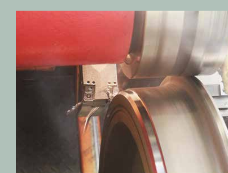
Beispiel für eine Radsatzdrehmaschine

Radsatzbearbeitung mindert Luftschall und Erschütterungen Problem: Durch starke Bremsvorgänge können am Radreifen Unrundungen (Flachstellen) entstehen, die Poltergeräusche beim Fahren verursachen.