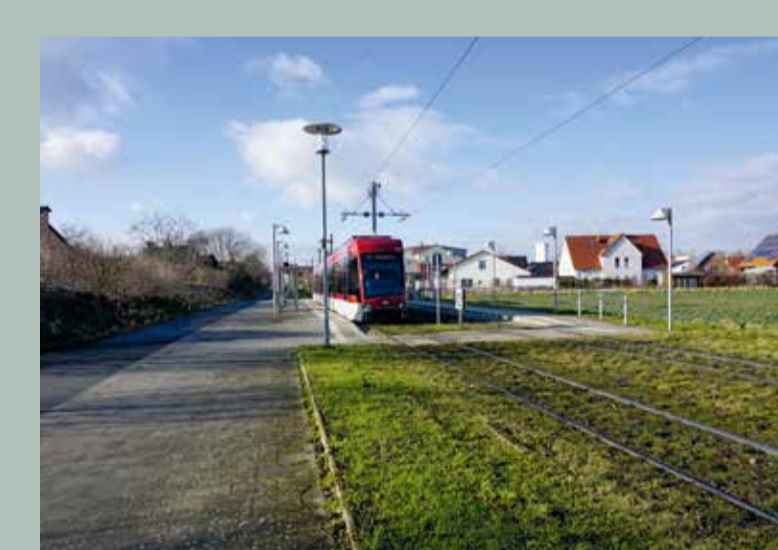
Beispiel: Rasengleis in Stockheim

Rasengleis mit hoher Eindeckung mindert Luftschall Die Schienen sind bis unterhalb des Kopfes mit Rasen eingedeckt. Die offene Struktur der Rasenoberfläche schluckt Schallwellen am Ort der Entstehung.