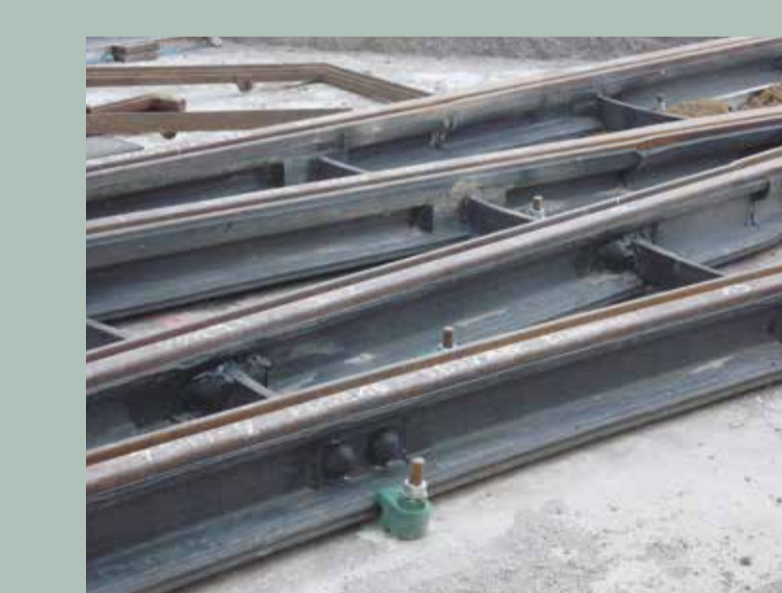
Elastische Schienenlagerung auf dem Hagenmarkt

Elastische Schienenlagerung Mit speziellen Gummiprofilen oder Unterlagen im Bereich des Schienenfußes wird das Gleis elastisch gelagert. Durch Einfederungen von ca. 1,5 mm werden Schwingungen aus dem Gleis wirksam gemindert.